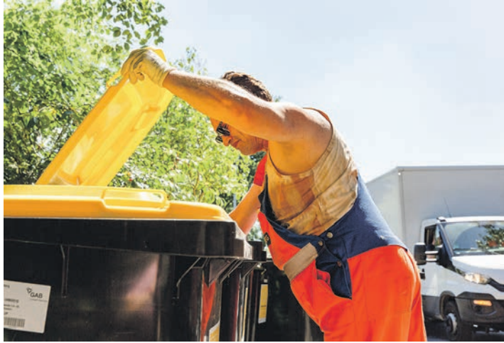
Stichprobenkontrollen: Es werden nur Behälter stehengelassen, wenn bei der Befüllung gravierende Mängel vorliegen.